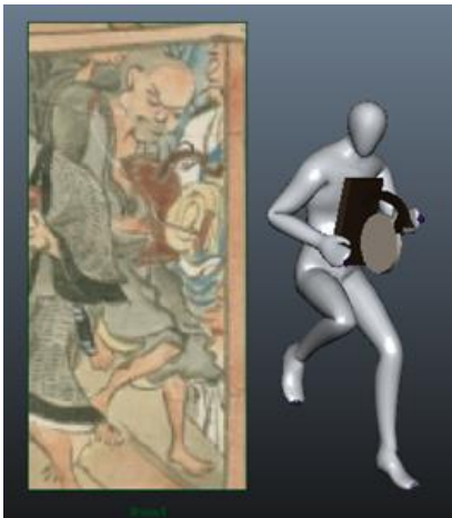
図 2 ポーズの取り込み