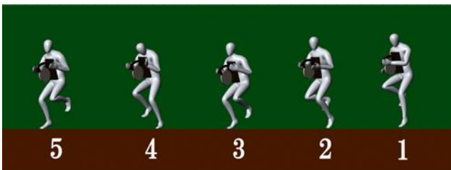
図 3-1 1～5のポーズ