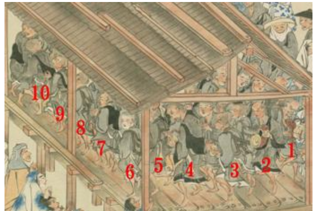
図 1 櫓の中の僧侶

ら、そのポーズを一つ一つ観察すると、足の踏み出し方だけでなく、足の上げ方、手の所作などが、人それぞれであり、揃って踊っている様子は伺うことができない。念仏を唱えながら踊ると記述されているにも関わらず、踊りは揃っていないという点が、大きな疑問であった。僧侶らは、念仏を唱える際は、必ず揃って唱えるものである。手にはそれぞれが鐘を持っており、それも、念仏のタイミングに合わせて打っていたと考えられる。このような状況で、なぜ踊りが揃っていないで描かれているのか、この問題を考えるために、踊り手のポーズを一人一人、3DCG の技術を使い、3D 化することにした。