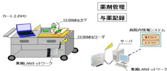
図3 薬剤情報取得システム