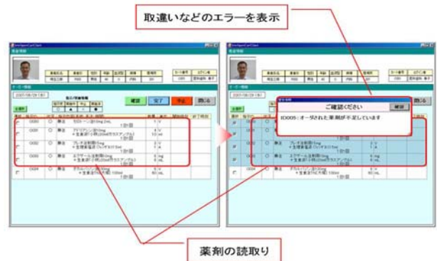
図4 薬剤情報取得におけるエラー表示