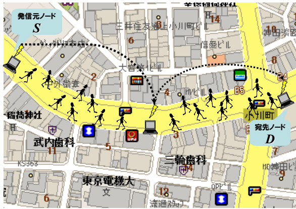
図 1.2 ホップ測定におけるノード配置